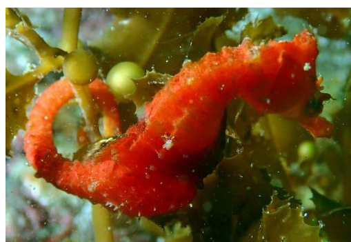
運がよければ海藻にハナタツも。