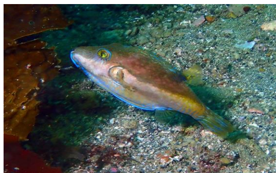
青くかがやくキタマクラも、