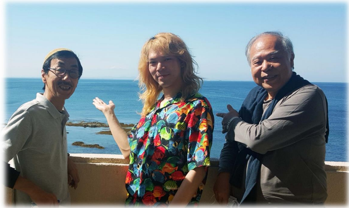
海あそび塾三役 実習会の予定場所「館山ステーション」にて