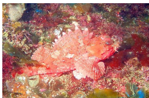
赤くてかわいいフサカサゴも、いる。