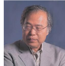
荒俣 宏さん (博物学者、小説家、翻訳家)

文化的で安定した暮らしが1万年以上続いた縄文時代。対して、テクノロジーの進化で、AI(人工知能)やAL(人工生命)、BT(バイオテクノロジー)など、見慣れぬ言葉が増え続け、目まぐるしく変化する現代。これから我々はどこに向かうのか。縄文時代と近未来を考えるとから見えるものとは? ポーラ企業文化誌『WE／』5・6月号で、熱く「縄文×近未来」について語っていただいた荒俣 宏さんと井浦 新さん。冊子には掲載しきれなかった内容を、今回はトークショーにて語っていただきます。縄文と近未来をかけあわせることでどのような「かなでる」が展開されるのか、ぜひご期待ください。