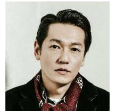
井浦 新さん (俳優)

※定員40名(先着順) 申し込みは下記公式サイトよりご確認ください。 https://www.pola.co.jp/we/pola_talkersmuseum/