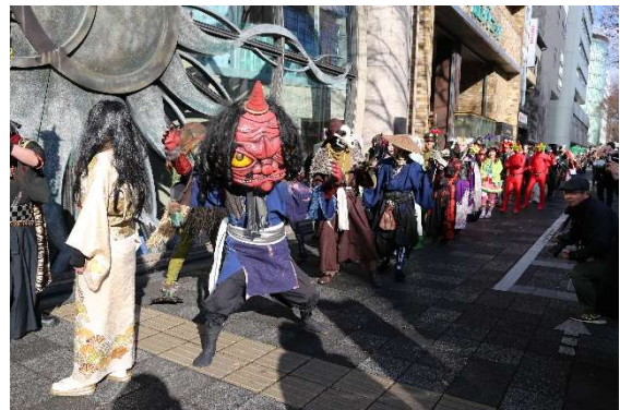
昨年の節分お化け☆百鬼夜行のパレード