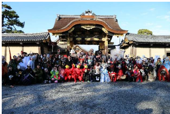
二条城唐門前での記念写真