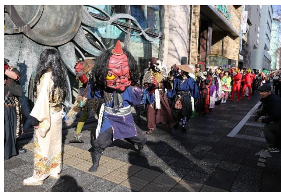
過去の節分お化け☆百鬼夜行のパレード